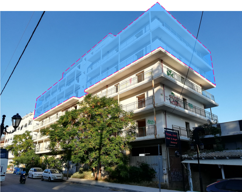
άποψη του κτηρίου από οδό Μπουμπουλίνας μετά τις εργασίες κατεδάφισης